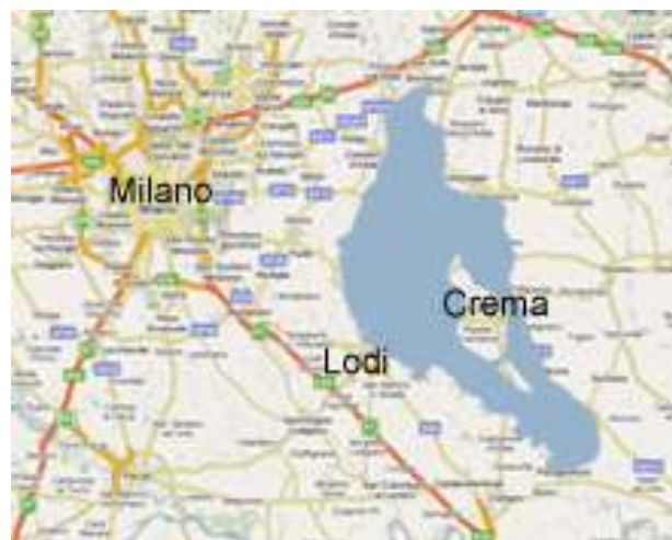
Come sarebbe oggi il lago Gerundo

L'agricoltura di queste contrade col passare dei secoli si finalizzò sempre più alla produzione del latte, i monaci perfezionarono antiche ricette, e la latterie annesse alle stalle lo trasformarono in sempre migliore formaggio. L'affermarsi della struttura della corte o cascina, condotta dalla azienda agricola capitalista (nel senso che l'affittuario pagava un affitto in contanti e non a mezzadria) permise l'accumulazione di capitali necessari al formarsi di una industria.