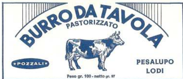
Carta del burro anni 40