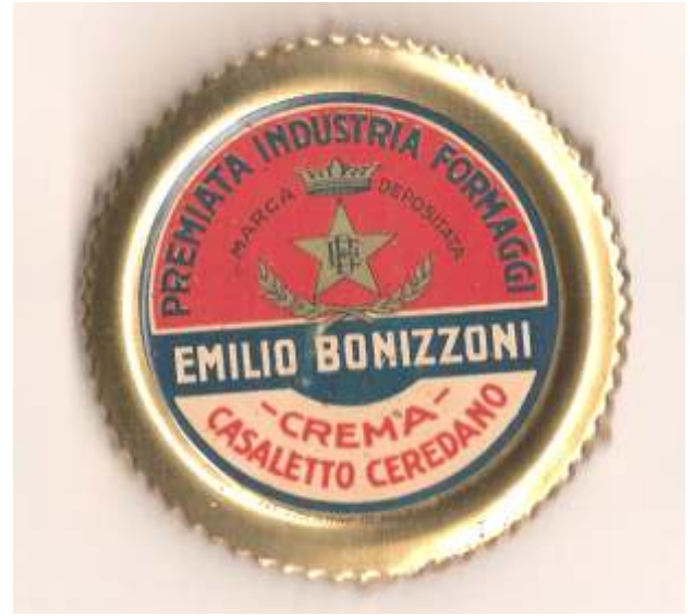
Placchetta da formaggio grana anni '50

All'inizio del secolo scorso (nel 1908) un giovane imprenditore rilevò dai Compostella il complesso della corte fondata secoli prima dai monaci; nasceva così il "Caseificio Cav. Emilio Bonizzoni", destinato a primeggiare nella trasformazione dell'ottimo latte locale in formaggi di grande rinomanza. La ditta Bonizzoni partecipa alle principali esposizioni nazionali e diviene famosa per il proprio Grana «nero», ed i provoloni, esportati in vari paesi europei