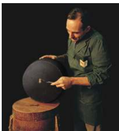
Controllo della qualità

Il latte proveniente da circa trenta aziende agricole del cremasco e del lodigiano arriva fresco sette giorni su sette per essere trasformato in ottimo formaggio grana, senza l'uso di additivi o conservanti, ma con il rigore della tradizione e dopo una lunga e paziente stagionatura viene spedito per essere apprezzato dal Nordamerica alla Scandinavia, grazie al lavoro appassionato di circa 50 persone, tra le quali gli eredi "dell'architetto", continuando così ad onorare la tradizionale laboriosità di queste contrade.