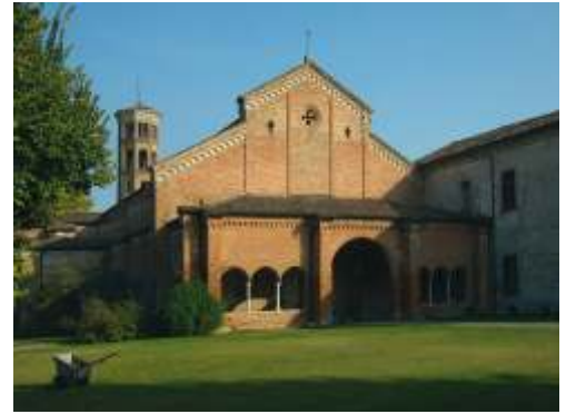
Abbazia del Cerreto

Allo stesso modo, per l'andamento di un confine tracciato bizzarramente, il paese di Abbazia Cerreto (3) si trova tuttora in provincia di Lodi, mentre il vicino Casaletto Ceredano, che anche nel nome evoca la dipendenza diretta colla venerabile abbazia, si annovera tra i comuni della provincia di Cremona; anzi la genesi stessa del villaggio di Casaletto Ceredano è da ricercarsi nella Grangia che i cistercensi del Cerreto edificano a presidio delle campagne più prossime alla loro Abbazia.