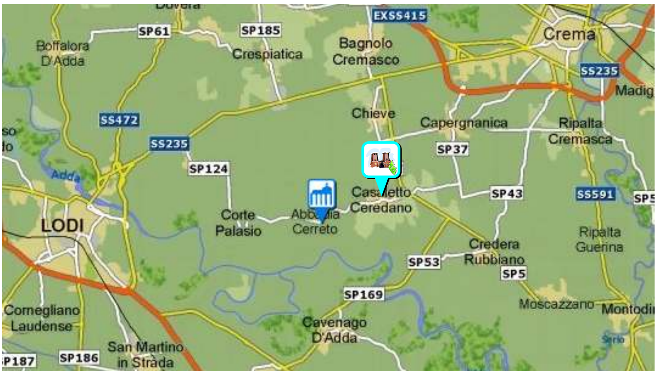
La zona di origine; l'Abbazia del Cerreto, il Caseificio