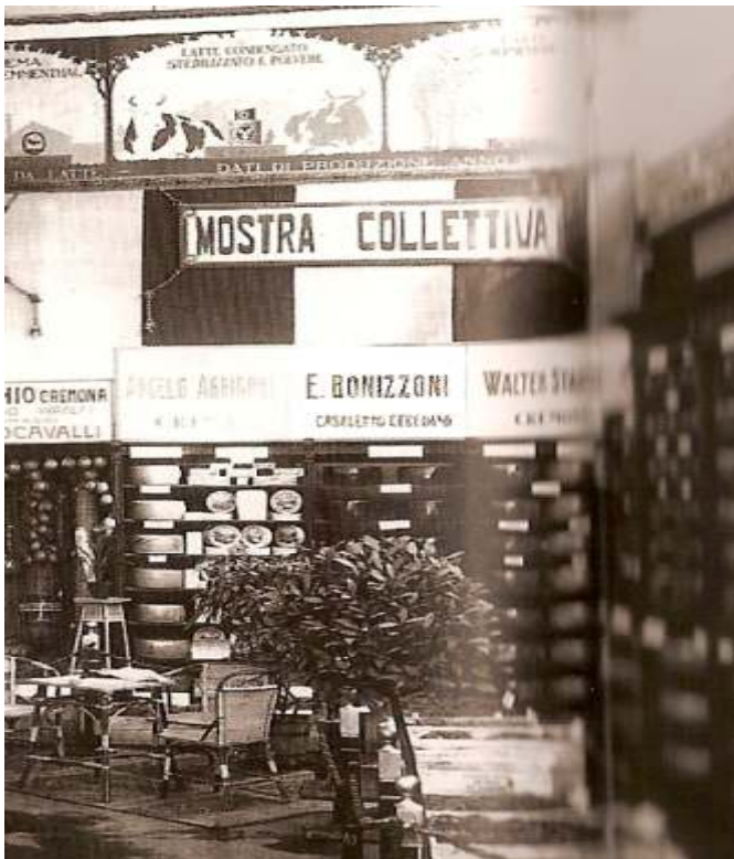
Forme nere in una fiera nel 1930