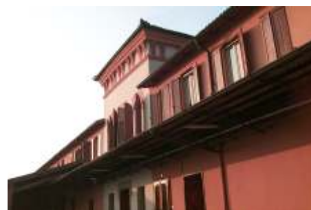
La torre a presidio del caseificio

All'interno della storica corte trova luogo il cuore della produzione, mentre le fasi successive sono state trasferite altrove per motivi di spazio; ogni momento della lavorazione è regolato da un Disciplinare di Produzione, il cui scrupoloso assolvimento è certificato da un organismo internazionale indipendente. Questo Disciplinare prescrittivo è stato redatto con il contributo storico-scientifico del Prof. Battistotti della Università Cattolica