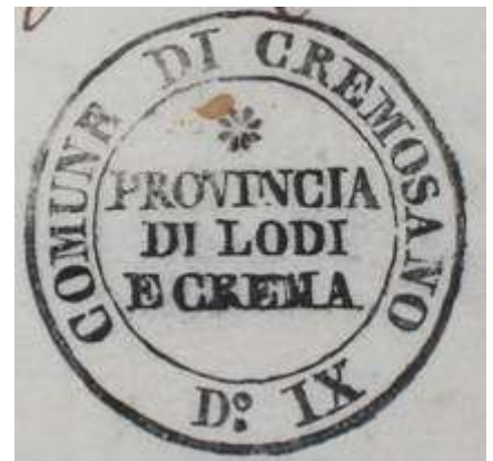
Immagine della provincia di Lodi e Crema La provincia di Lodi e Crema era una provincia del Regno Lombardo-Veneto, istituita nel 1815 ed esistita dal 1816 al 1859.