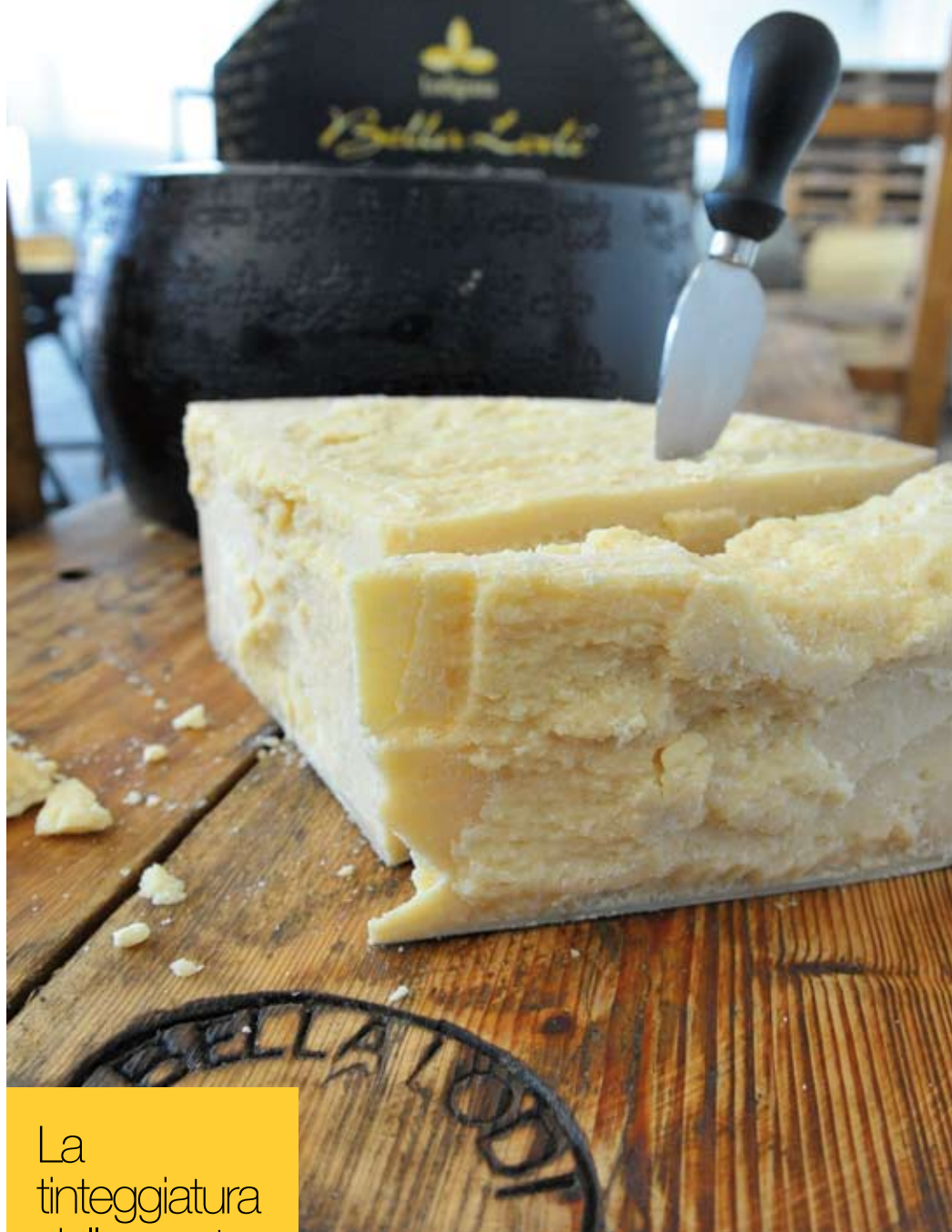
A dispetto della sua crosta nera, la pasta di Bella Lodi è insolitamente bianca, con rade variazioni stagionali

La tinteggiatura della crosta avviene con colori naturali. Un tempo era effettuata con una miscela di argilla, olio di vinaccioli e carbone o fuliggine