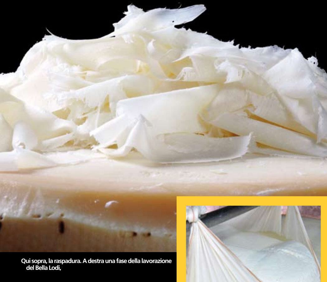
Qui sopra, la raspadura. A destra una fase della lavorazione del Bella Lodi.